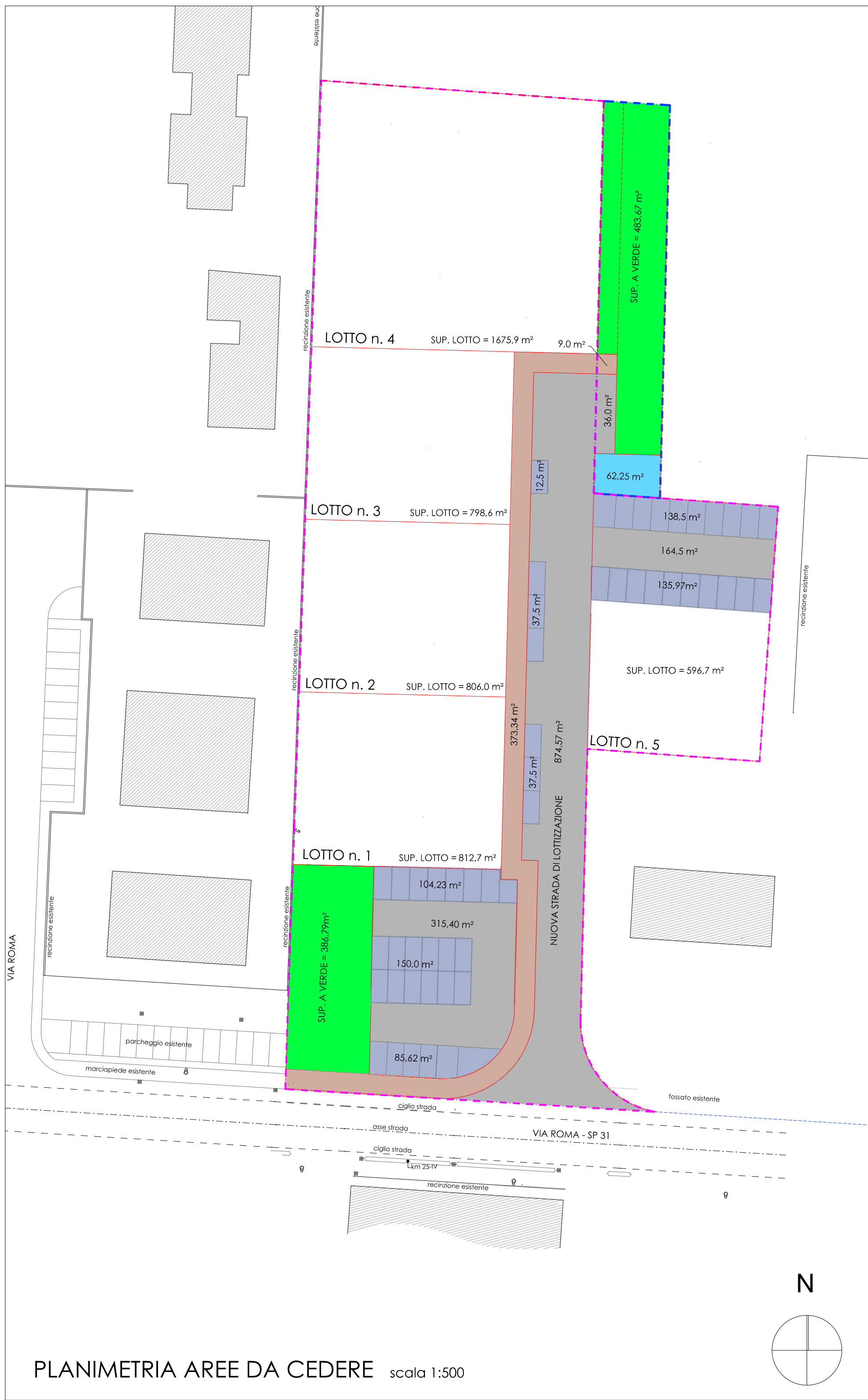
PLANIMETRIA AREE DA CEDERE scala 1:500